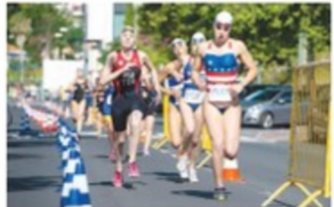
Os portugueses estiveram em bom plano neste primeiro dia.

Hoje realizam-se as finais do Biatle, com as competições a iniciarem-se às 9h30, terminando pelas 15h35.