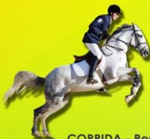
CORRIDA - Resistência

A Corrida é uma das provas mais emocionantes, uma vez que o sistema de partida por "handicap" acaba por determinar quem corta a meta em primeiro lugar é o vencedor.