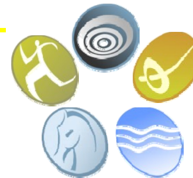
TABELA "OPERAÇÃO DESCOBERTA"