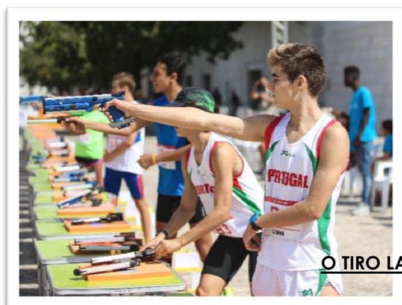
O TIRO LASER

O LASER RUN É UMA PROVA CONTÍNUA DE DOIS SEGMENTOS: CORRIDA E TIRO LASER. O REGULAMENTO ESTABELECE AS DISTÂNCIAS DA CORRIDA QUE VARIAM CONFORME OS ESCALÕES ETÁRIOS, O MESMO ACONTECENDO COM O Nº DE SÉRIES DE TIRO. O VENCEDOR DE UMA PROVA DE LASER RUN É O ATLETA QUE CRUZAR A LINHA DE META EM PRIMEIRO LUGAR (MELHOR CRONO) DEPOIS DE PERCORRIDAS AS DISTÂNCIAS DE CORRIDA E CUMPRIDAS AS RESPECTIVAS SÉRIES DE TIRO LASER